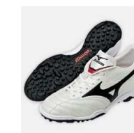
ひも付きの運動靴